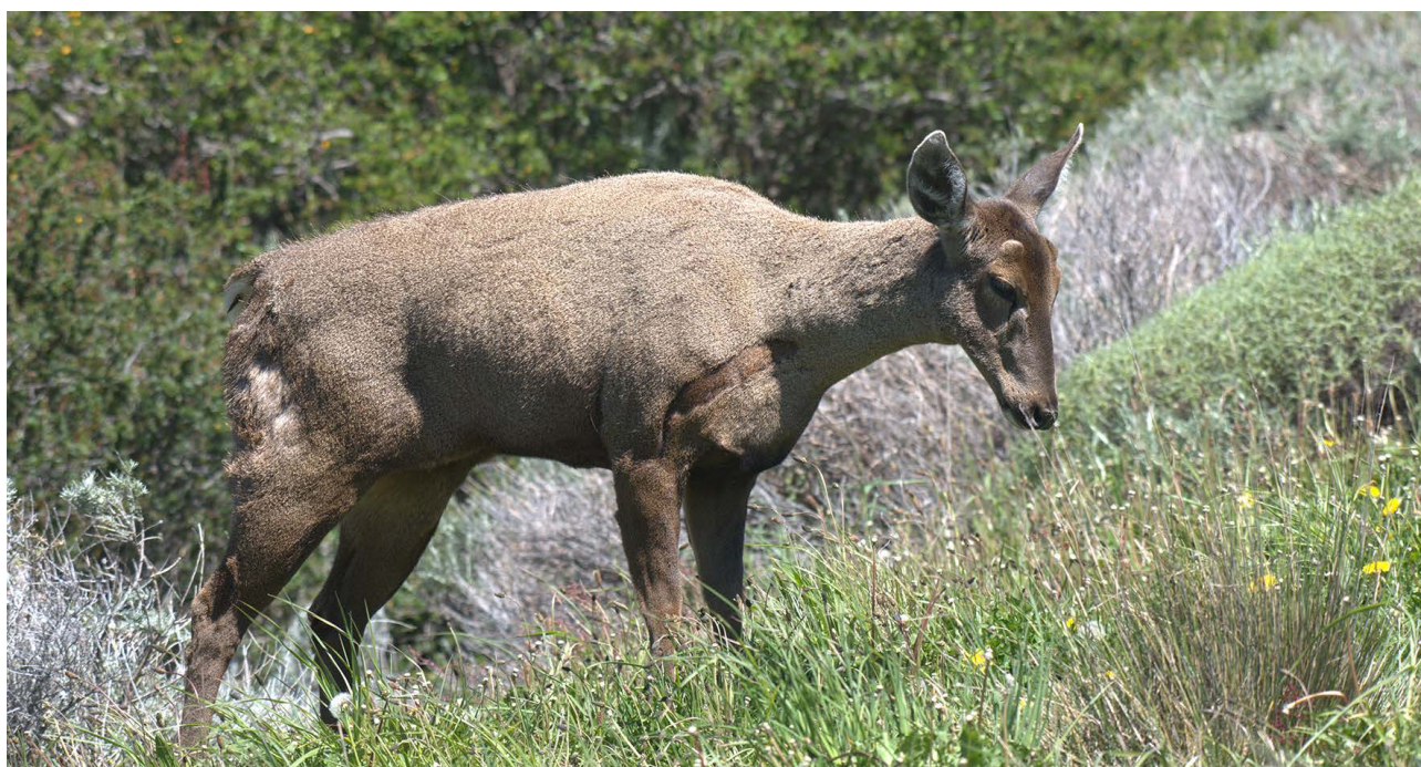
Figura 1.2. Huemul en su medio natural.