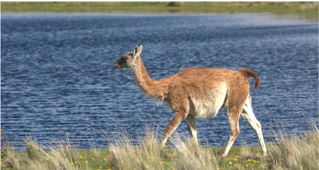
Figura 1.1. Guanaco en su medio natural.

En la actualidad se estima que la población de guanacos consta de unos 600 a 700 mil individuos, con el 90 por ciento en la Argentina (Vilá 2012). Mientras que el número de individuos en cautiverio estaría bordeando los 1.000 ejemplares (Bas & González 2000). Se estima que previo a la colonización europea su número alcanzaba entre 30