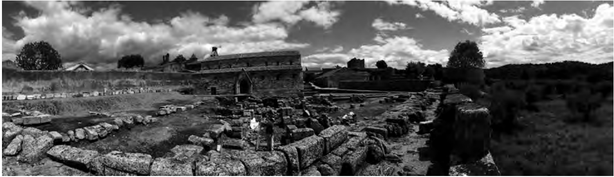
Fig. 1.6. Panorámica del yacimiento del Paço dos Bispos de Idanha-a-Velha.