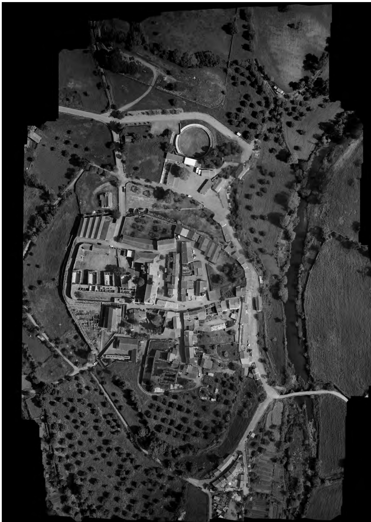
Fig. 1.5. Ortofoto de Idanha-a-Velha.