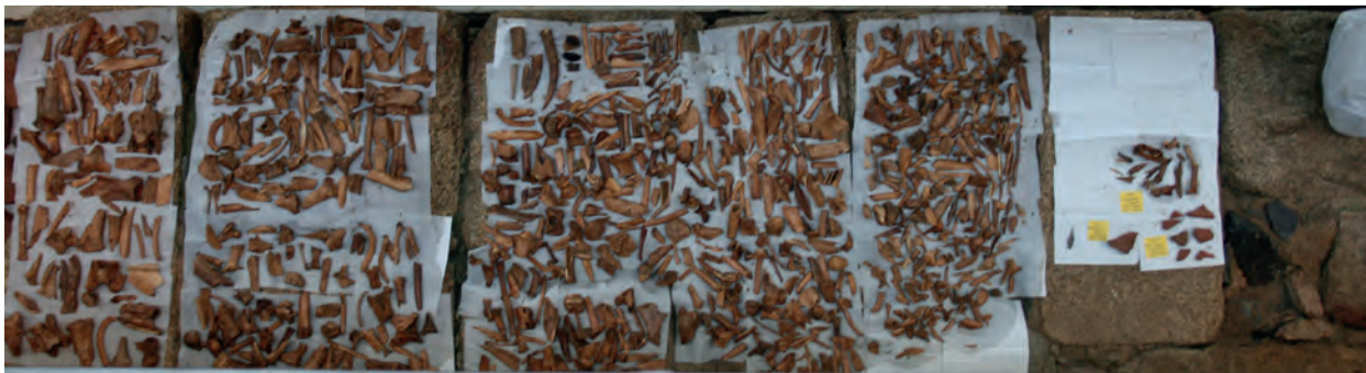
Fig. 1.8. Material óseo y cerámico recuperados en la excavación de 2014 en el Paço dos Bispos.

Del mismo modo, a partir de la lectura estratigráfica de los alzados, ha sido posible diferenciar diversos momentos constructivos, desenmascarar la serie de espacios adosados a la muralla y definir sus características técnicas, pues ésta actividad resulta imprescindible para finalmente identificar cuál es la planta original de la estructura episcopal y cuáles son sus reformas posteriores, es decir, establecer su secuencia constructiva–destructiva–constructiva (figs. 5 y 6).