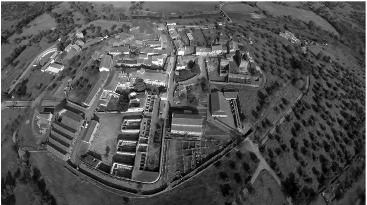
Fig. 1.1. Vista general de Idanha-a-Velha. Imagen obtenida con un dron en 2018.

Keywords: Iberian Peninsula, Idanha-a-Velha, state-of-the-art, archaeology, landscape archaeology, fieldwork.