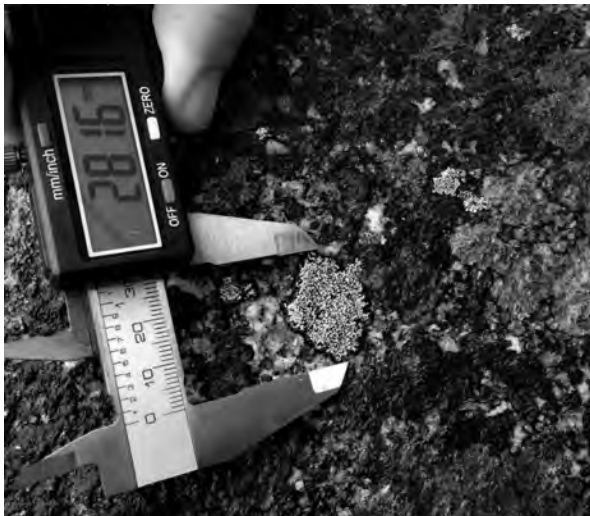
Fig. 1.7. Medición de líquenes como método de datación de las estructuras en piedra.

escala para poder aplicarlo al conocimiento de otros yacimientos peninsulares de complejidad similar. Es el caso de Los Hitos (Arisgotas, Orgaz), Pla de Nadal (Ribarroja del Turia, Valencia) y el suburbio de la Vega Baja (Toledo), que cuentan con un número importante de excavaciones antiguas que necesitan de un estudio global pero exhaustivo para interpretar los datos disponibles sin necesidad de excavación (fig. 5).