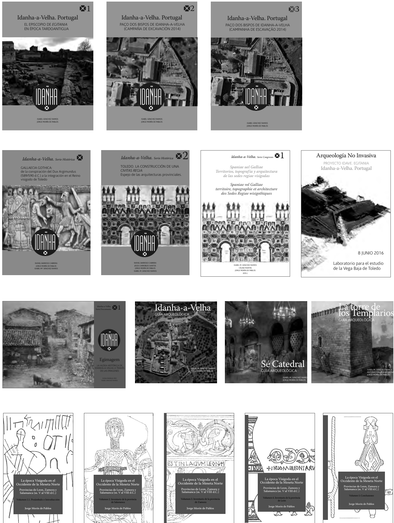
Fig. 1.9. Publicaciones del proyecto Ida Ve.