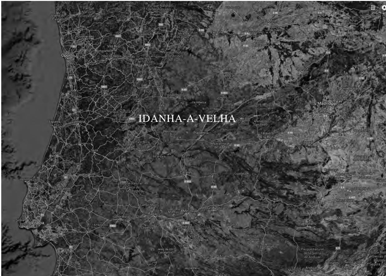
Fig. 1.2. Localización de Idanha-a-Velha (Portugal), al norte de Castelo Branco ( https://satellites.pro/Idanha-a-Velha_map#39.9965 ).